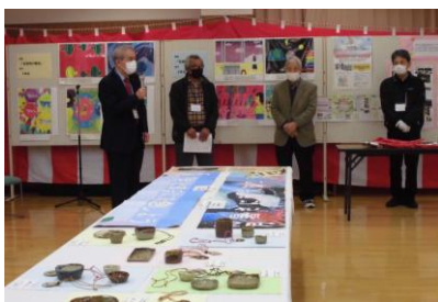
青木コミ協会会長挨拶